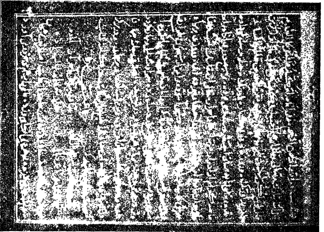
صورة للورقة الأولى من مخطوط «مسألة تسليمة الاخوان المفظوط بالكتابة الالهية بباريس